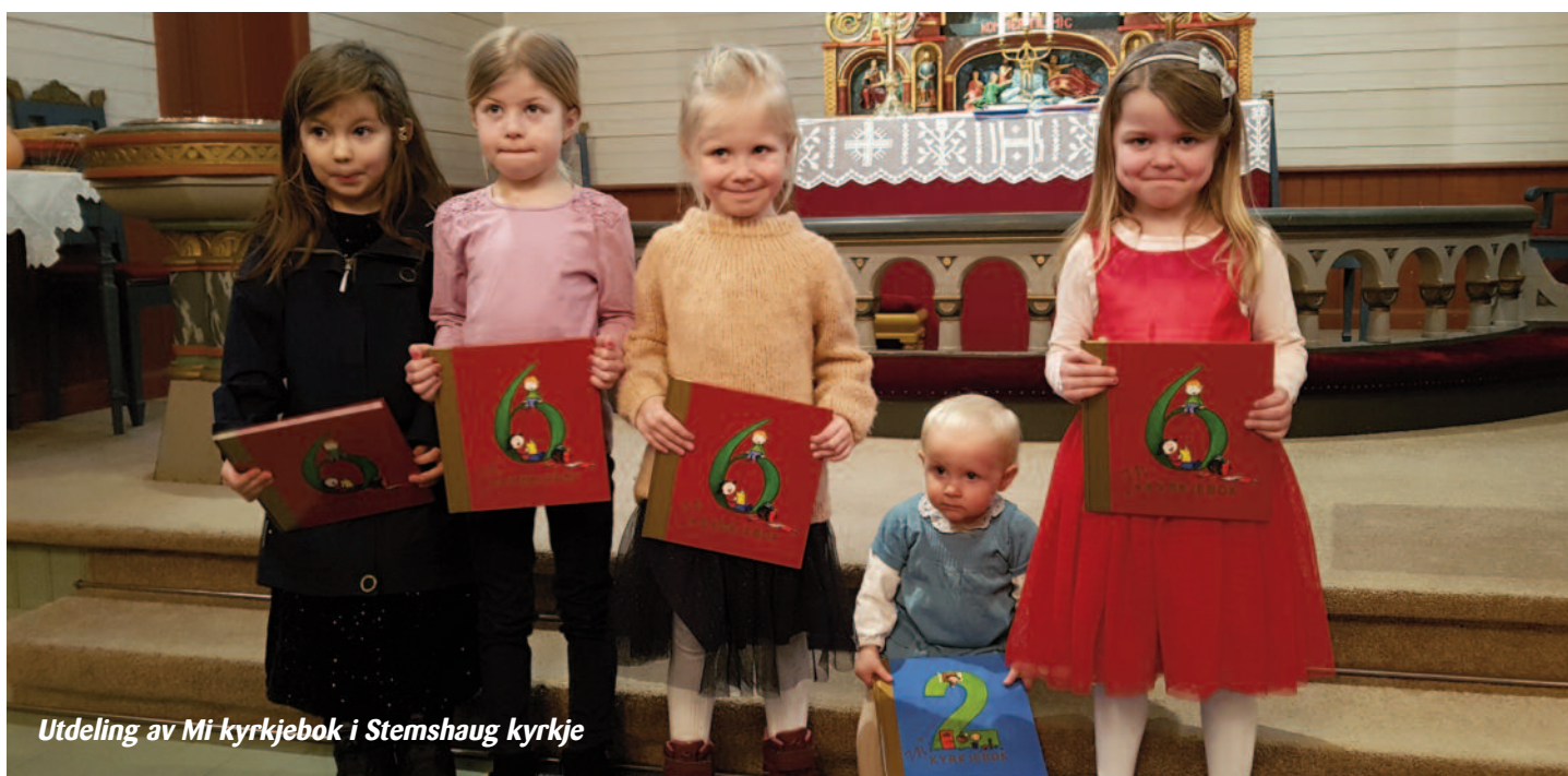
Utdeling av Mi kyrkjebok i Stemshaug kyrkje