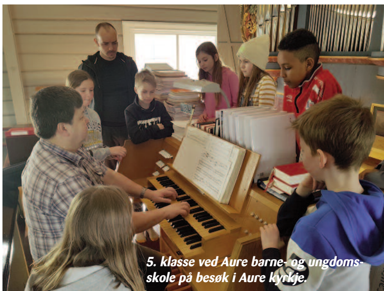
5. klasse ved Aure barne- og ungdomsskole på besøk i Aure kyrkje.